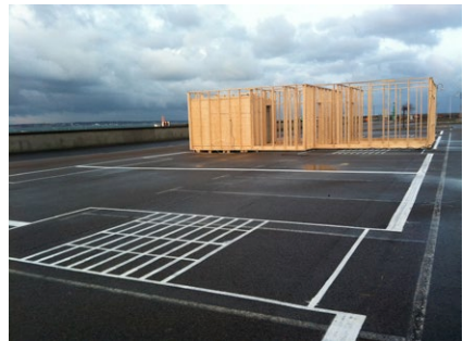
ELIN STRAND RUIN

↑ I samarbete med lokala kvinnliga nätverk uppfördes My Kitchen 2011 i Folkets hamn, H+, Helsingborg. Projektet undersöker köket som publik plats, och samtidigt den intima plats där vi lagar mat, samtalar och umgås, hjälper barn med läxor och bygger våra sociala nätverk.