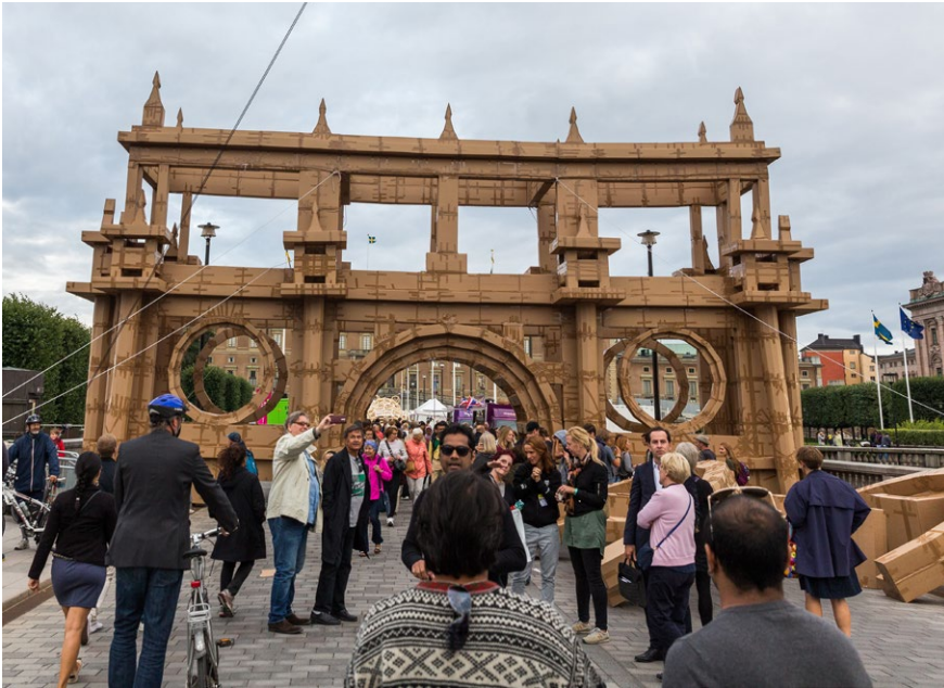
ADRIAN PEHRSON / STUDIO EMMA SVENSSON

Chef kulturstrategiska staben, kulturförvaltningen