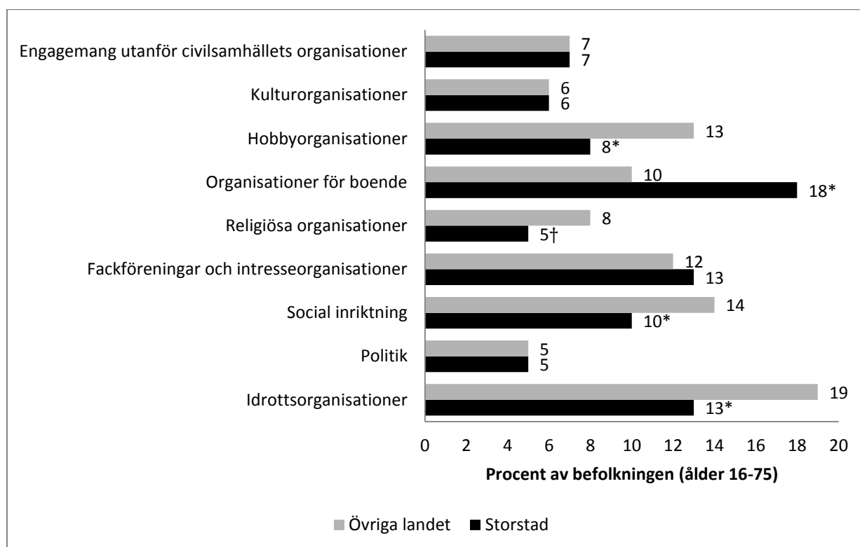
Figur 1 Andel ideellt arbetande av befolkningen per organisationskategori, boende i storstad jämfört med övriga

Siffrorna är uttryckta i procent av befolkningen N=1253. *=skillnaden är statistiskt signifikant, p < 0,05 (tvåsidigt \chi^2 -test). †=skillnaden är statistiskt signifikant, p < 0,10 .