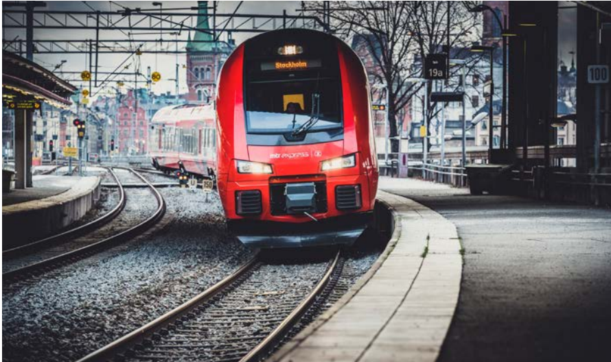
De anställda som väljer tåg istället för flyg får extra semesterdagar både på MTR Express och konsultföretaget Edges i Malmö.