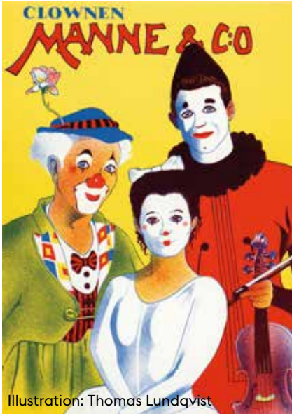
Illustration: Thomas Lundqvist